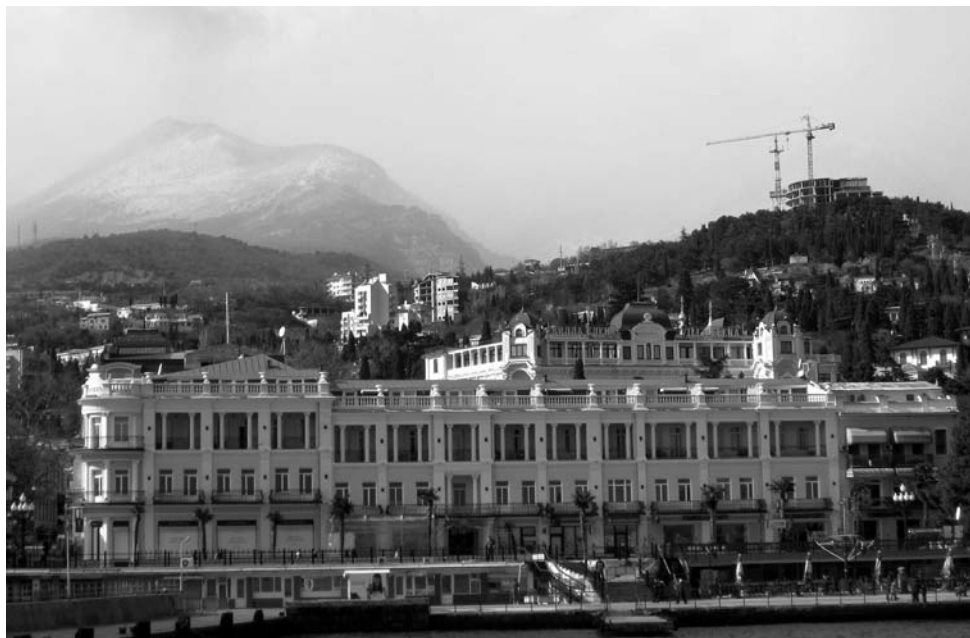
Blick vom Meer auf Jalta und das verschneite und im Nebel liegende Krimgebirge

Und genauso traf es auch ein. Auf der Fahrt nach Feodosija wurden wir gestoppt. Ich kurbte das Fenster hinunter. Im Regelfall stellen sich die Milizionäre mit Dienstgrad und Namen höflich vor und fordern zunächst einmal die Papiere. Das erste Wort unseres heutigen Kontrolleurs war jedoch ein unfreundlich gebrummeltes „Straf“. Ich frage freundlich nach, warum denn oder was für eine Strafe. Er antwortet nur: „große Straf“. Aussteigen, ins Polizeiauto einsteigen. Mittlerweile kenne ich schon so einige Polizeiautos von Innen. Also plaudere ich etwas mit dem Polizisten, er schreibt sich ein bisschen etwas auf. Irgendwann erfährt er, dass ich Pastor bin. Dann merkt er, dass kein Bestechungsgeld fließen wird. Und schließlich erwähne ich so nebenbei, dass im Auto noch der Bischof sitzt. Schließlich heißt es: „Sie dürfen wieder gehen. Gute Fahrt!“. Ab und zu hat man hier in