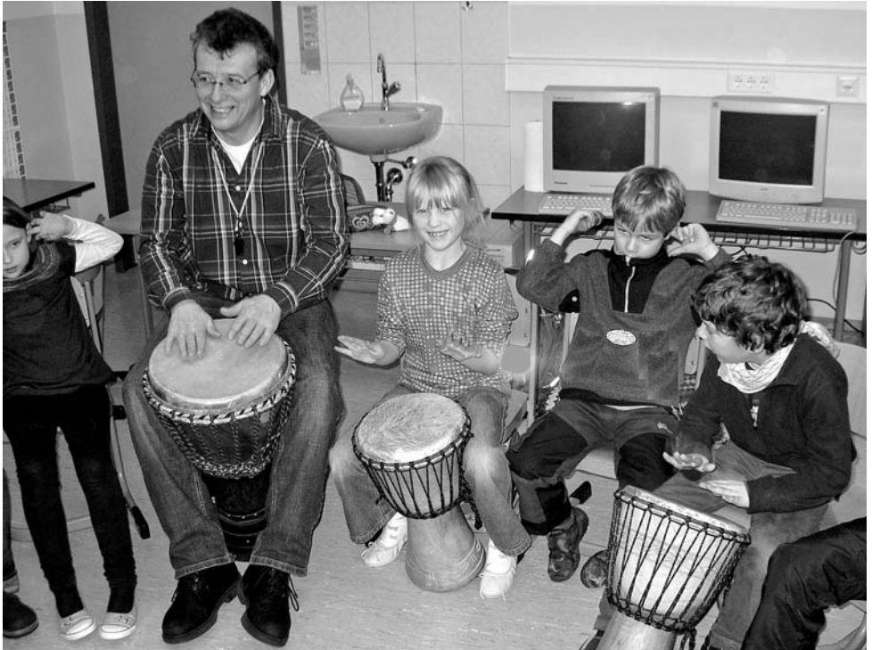
1. Klasse beim Rhythmiktraining mit afrikanischen Trommeln

bekannte Strecke im Klassenzimmer mit Hilfe des Stockes ertasten und gehen. Doch am meisten faszinierte die Kinder der Blindenhund mit Namen „Watson“, der einer der beiden Frauen gehört. Schon nach kürzester Zeit waren sie von ihm ganz eingenommen und von seinen besonderen Fähigkeiten beeindruckt. Seine Besitzerin führte verschiedene Befehle mit ihm vor, auf die er zuverlässig und folgsam reagierte.