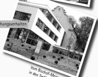
Vom Bischof-Meiser-Haus bis in den Treffpunkt Familie