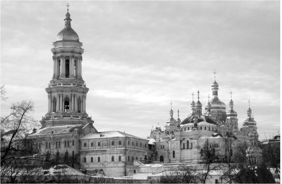
Die Lawra in Kiew - eines der bedeutendsten Klöster der orthodoxen Kirche

feiern, dass der Wagen nicht mag. Ob er etwas gegen Jalta hat? Beim ersten mal ging die 12 Jahre alte Batterie nicht mehr - minus 20 Grad waren für sie dann eben doch etwas zu viel. Beim nächsten Mal konnte ich zwar losfahren, hatte aber schon nach nur wenigen Kilometern einen qualmenden platten Reifen. Gott sei's gedankt ist mir das am Ortsausgang passiert, direkt an einem Parkplatz. Ich hätte den Reifen nicht im Schneesturm auf der viel befahrenen Straße übers Krimgebirge wechseln wollen! Im Gegensatz zur neuen teuren Batterie, die aus Deutschland eingeführt wurde, hat das Reifenflicken nur knappe drei Euro gekostet. Und zum Dritten: Vorletzten Sonntag wollte nun der Scheibenwischer nicht arbeiten - also auch keine gute Idee, mit dem Auto ohne Scheibenwischer nach Jalta zu fahren während es schneit. Die Scheibenwischer wurden zwar erst