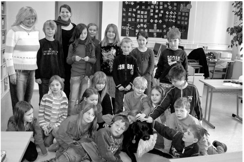
Schüler der 3. Klasse mit Blindenhund „Watson“

Mit einer Punktschriftmaschine wurden die Namen der Kinder geschrieben, so dass nun jeder seinen eigenen Namen mit dem Finger „lesen“ kann. Spannend – und gar nicht so einfach – war das Gehen mit einem Blindenstock. Dazu wurden die Augen verbunden und die Kinder mussten eine kurze, eigentlich